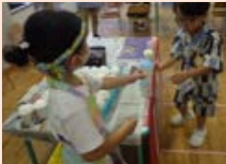
かきごおりやさん

7月14日、なつまつりをしました。ヨーヨーつり、輪投げやワニたたきなど、いろいろなお店を親子で一緒にまわりました。らいおん組は自分たちでお店を考えて、「たまあて」と「かき氷」のお店を準備しました。ひよこ組、ぱんだ組、りす組のお友達に優しく教えたり、一生懸命店番をしたりして、立派なお兄さん、お姉さんとして頑張ることができました。最後は、保護者の方も一緒にみんなで盆踊りを踊って、思い出に残る楽しい一日となりました。