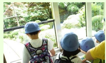
ケーブルカーから見る斜面にビックリ！