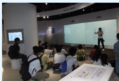
福島環境創造センターにて