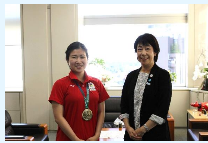
教育長と記念撮影