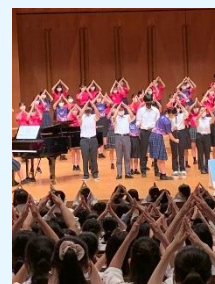
大会イメージソング「君へつなぐ」の合唱 会場全体が一体になりました。