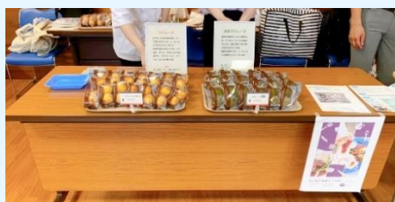
マドレーヌ販売 完売御礼！

新聞部門の会場では、本校で製作したマドレーヌを販売しました。生徒自ら看板をもって会場内を回り積極的に宣伝したことで、全国の新聞部高校生をはじめ、関係者の方々にお買い上げいただき完売しました。また、菓子販売だけではなく、ろう学校を知ってもらうために自分の名前を手話で表す交流ブースを特設し、全国の高校生と交流を深めました。手話に興味をもっている方が多く、手話で話しか掛けてきてくれました。さらに、新聞部の高校生から菓子販売について取材を受け、交流することもできました。