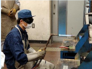
ガスバーナーで金属を溶かします

この講習は、都内の特別支援学校では本校のみが実施しています。今回、本校の生徒も2名合格し、修了証を取得することができました。