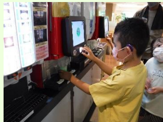
好きなジュースを選びました。