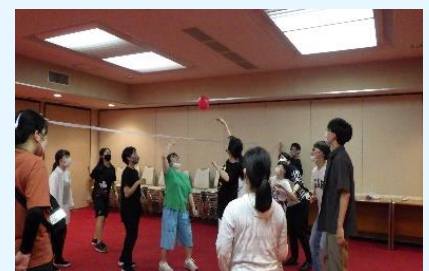
盛り上がったレクリエーション