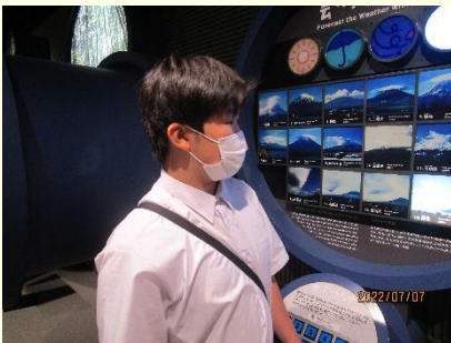
富士山世界遺産センター なぜ富士山が世界遺産に なったのかを学びました。