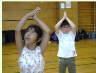
バナナおに「バナナ！」