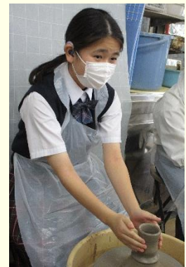
陶芸体験 湯呑みを作りました。