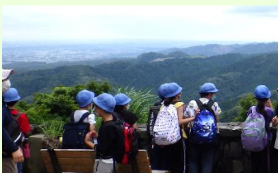
高いところから見る景色は最高！

2日目、心配していた天候ももち、みんなで高尾山に登りました。高尾山からの眺めや自然に触れることができました。