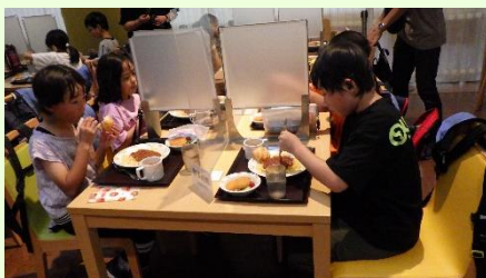
「ハンバーグ おいしいね。」

宿泊部屋では、みんなで協力して布団敷きをしました。レストランでは、食後のジュースを楽しみに、お腹いっぱい食べました。