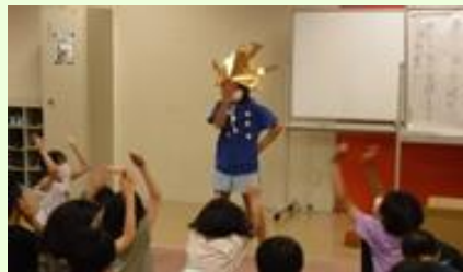
天下統一！「ははあー」