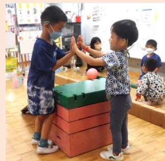
ボーリング (らいおん組のお店)