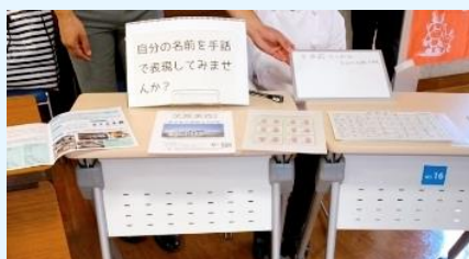
特設の交流ブース