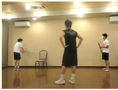
夜のレクリエーション 目隠しチャンバラや無人島 ゲームを楽しみました。