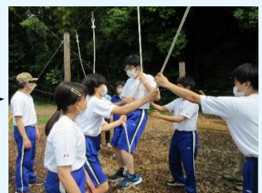
2年生 高尾の森わくわく ビレッジ