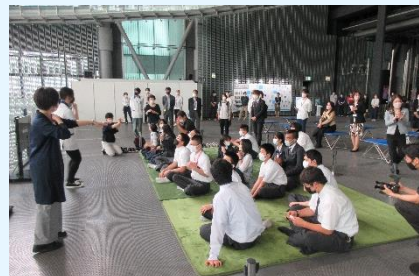
1年生 日本科学未来館

普通科2年生は高尾の森わくわくビレッジへ行きました。絞り染めエコバッグ制作とプロジェクトアドベンチャーという仲間づくり活動をしました。一日を通して、友達との絆が深まりました。