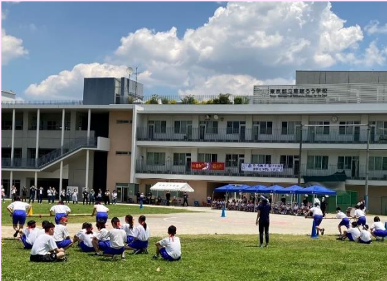
中学部の団体競技「台風の目」

今月号から学校だよりの紙面をリニューアルいたしました。多くの皆様に学校のトピックスを御紹介できればと思っています。どうぞよろしくお願いいたします。